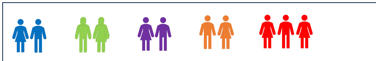
AV huidige overgangperiode