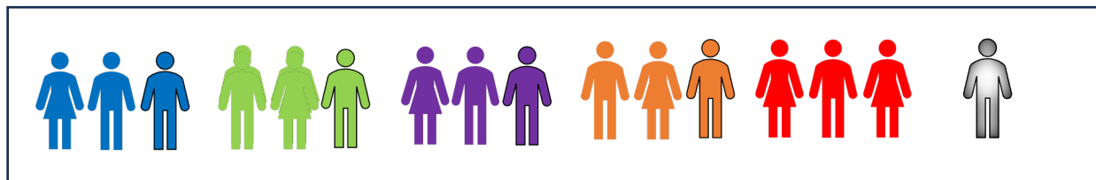
AV situatie voor november 2023